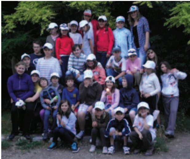
Montag - Nachmittag: Alle Teilnehmer sind eingetroffen!