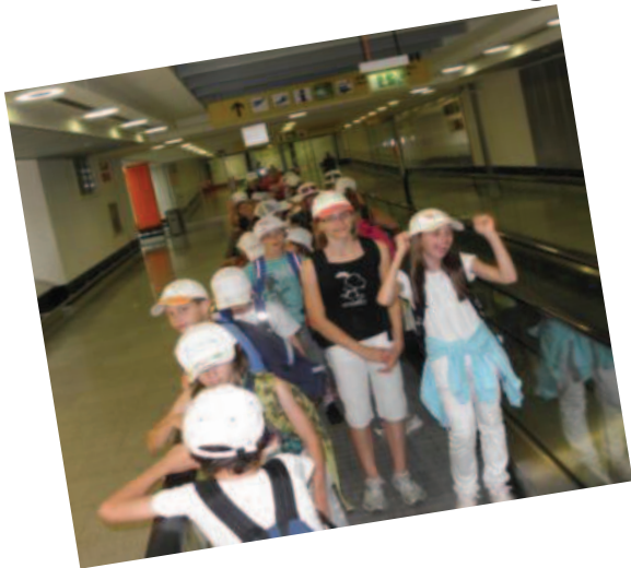
Dienstag: Der Flughafen wurde von uns „inspiziert“!