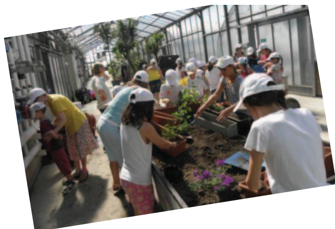
Fleißige Gärtner im Reservegarten Hirschstetten.