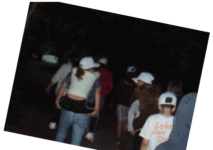
Am Abend, das erste Highlight, die Nachtwanderung.