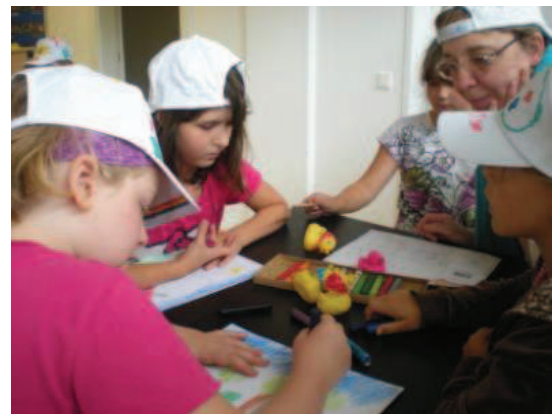
Im Gänsehäufel entwarfen wir eine Comicgeschichte.