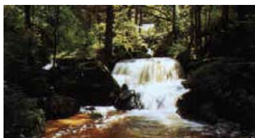
Wanderung zum Lohnbachfall

Es sind noch Plätze frei!!! Fahren Sie mit. Es wird bestimmt ein schöner Tag.