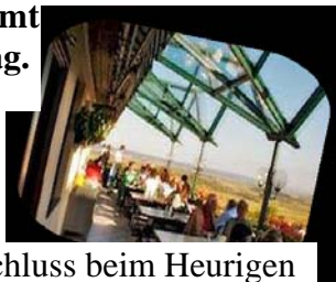
Abschluss beim Heurigen